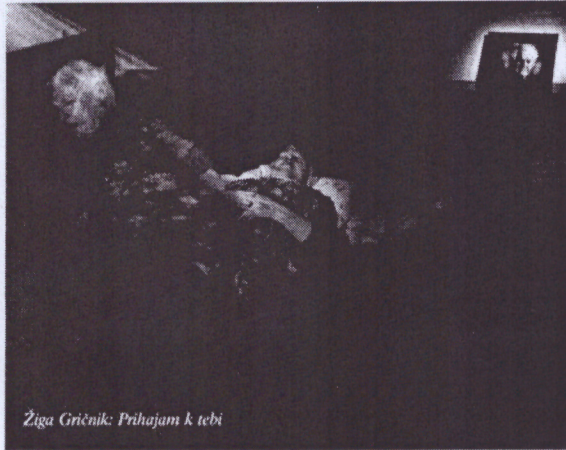
Žiga Gričnik: Prihajam k tebi