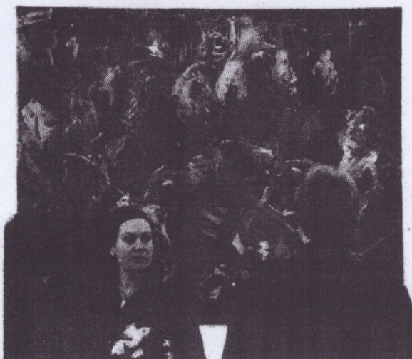
Manifestacija svake godine privlači sve više posjetitelja

sjetitelja – otkrivaju u udruzi Pasiionska baština. Glazbeni dio manifestacije bit će obilježen i uskrsnim običajima i pjesmama koje će izvesti ženska udruga Našenina 31. ožujka u 20 sati u crkvi svete Katarine, a u srijedu 1. travnja u 20 sati u katedrali će nastupiti i ansambl Lado. Zagrepečani će moći razgledati i izložbu na temu hrvatskog Uskrsa koja se otvara u utorak u 19 sati u Staroj gradskoj vijećnici, a slična izložba otvara se dan poslije i u Mimari. U sklopu Pasiionske baštine raspisuje se i likovni natječaj za najbolje radove. Manifestacija traje do 8. travnja.