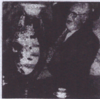
Ante Topić Mimara

DOROTEJA JENDRIĆ Muzej Mimara otvoren je u Zagrebu uz veliku medijsku prašinu 17. srpnja 1987. godine u preuređenoj bivšoj gimnaziji, koja je postala muzej po volji donatora Ante Topića Mimara.