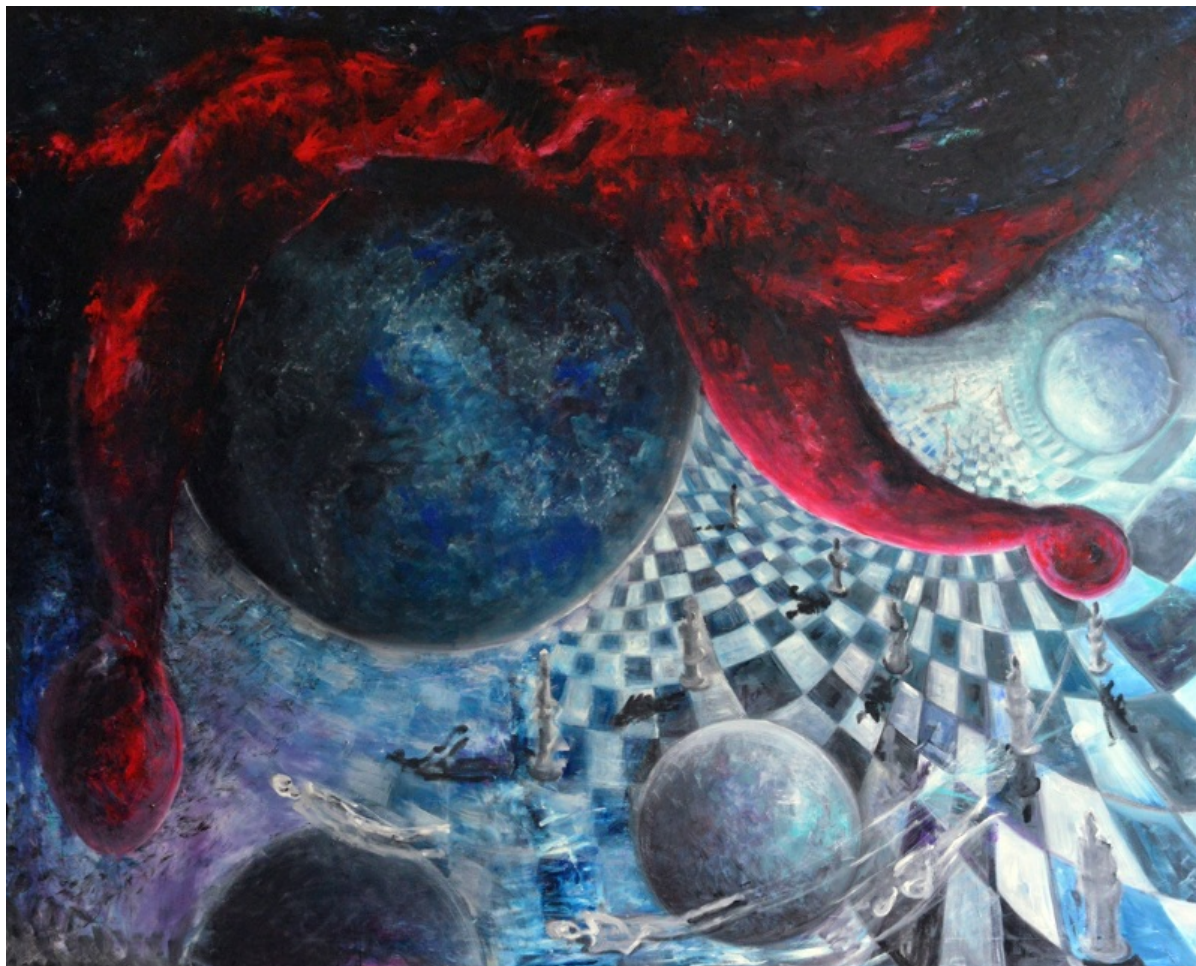
Pod kapom lude